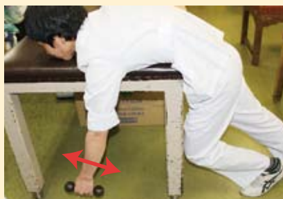
肩の力を抜き、腕の重みで前後左右に動かす

痛みが強い急性期には、炎症を拡大させないために楽な姿勢をとることや痛みを回避すること、“安静”が有効です。