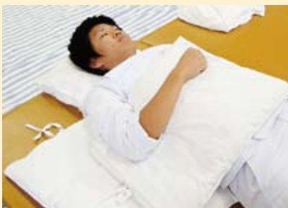
肩・肘・肘と寝具の間にタオルや枕を挟む