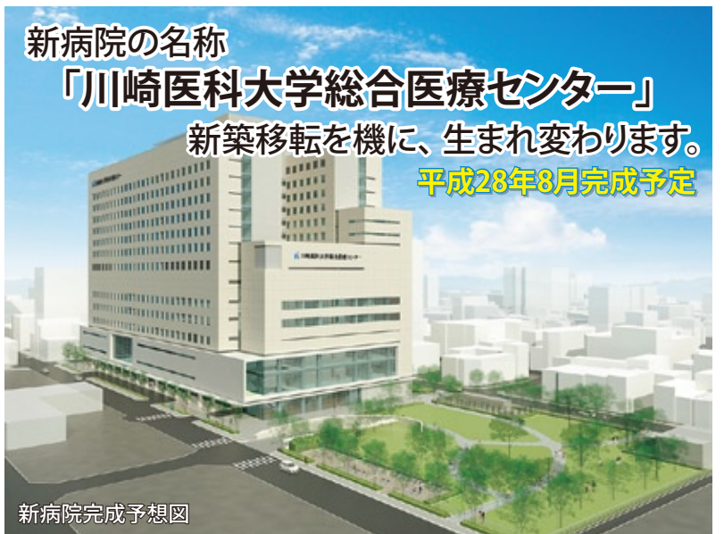
新病院完成予想図