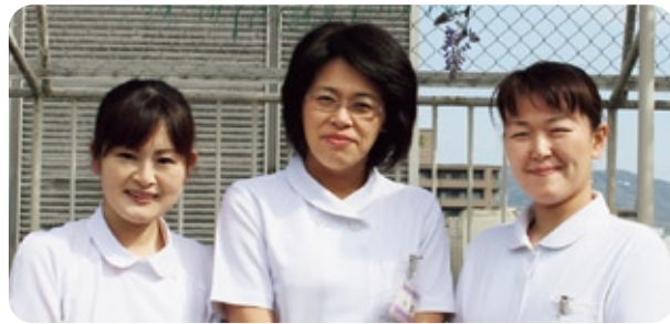
入退院サポートセンター

最後は、禁酒・禁煙です。たばこの煙には、有害物質が200種類も含まれており、その中のニコチンは血管を収縮させ、脈を増やし不整脈や狭心症発作を誘発します。さらに、血液をドロドロにして血栓を作りやすくなり、脳梗塞等のリスクを高めます。手術後は一般的に痰の量が増えますが、喫煙される方