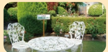
屋上庭園（ふれあいガーデン）

〒700-8505 岡山県岡山市北区中山下2-1-80 TEL. (086) 225-2111 (代) FAX. (086) 232-8343 病院庶務課庶務係 (内線) 3316, 3318 http://www.kawasaki-m.ac.jp/kawasakihp/ E-mail: kwsyomu@med.kawasaki-m.ac.jp