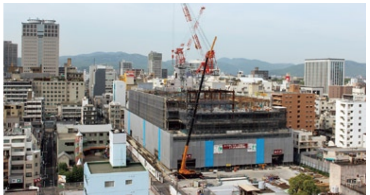
工事全景（平成27年4月24日撮影）