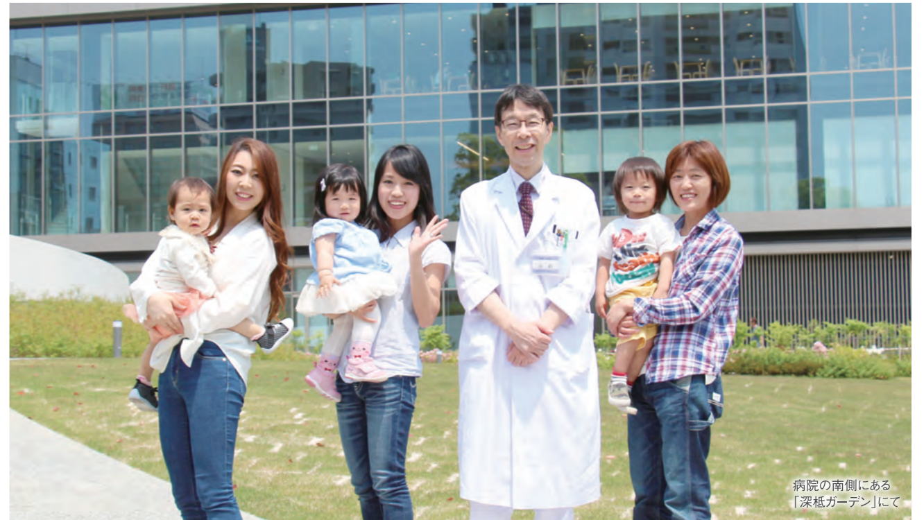
病院の南側にある「深紙ガーデン」にて

日本小児科学会専門医・指導医 / 日本感染症学会専門医・指導医 / ICD制度協議会認定インフェクションコントロールドクター (ICD) / 国際渡航医学会 渡航医学専門医 / 臨床研修指導医