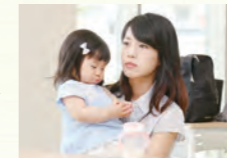
児山ママ・友彩ちゃん(2歳)

口の中の水泡は、痛がるお子さんが多いのですが、すぐには治りません。口当たりが良く、しみないものを食べさせて脱水に陥らないように気をつけましょう。